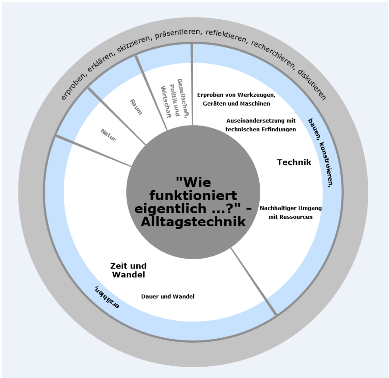
Abb.4: Beispiel für die Erstellung eines Lern- und Handlungsfeldes im Sachunterricht